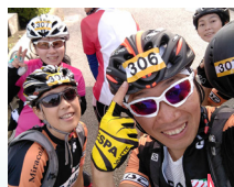
みんなでミッションをクリアしよう!